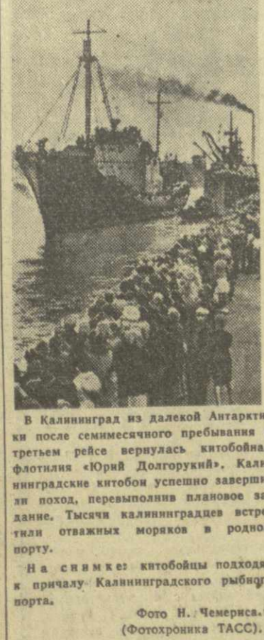
В Калининград из далекой Антарктики после семимесячного пребывания в третьем рейсе вернулась китобойная флотилия «Юрий Долгорукий»...