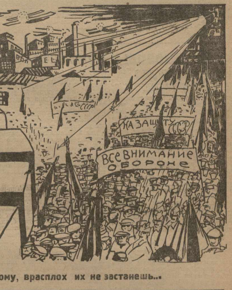
—А, ведь, повидному, врасплох их не застанешь...

Рабочие захватили суд и главный почтамт. По официальному сообщению, ранено 130 чел.; большинство их — полицейские. УБИЙЦЫ ОПРАВДАНЫ ВЕНА, 15-17 (Закат). Венский суд присяжных оправдал членов фашистской организации фронтовиков, убивших в конце января двух рабочих в Шаттендорфе.