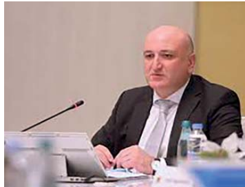
კომპანიების შეეზღუდვებით კლინიკებში მარკეტინგული აქტივობები და ფარმაცევტული კომპანიების შრიდან ექიმისთვის გადახდული ყოველი ლარი დადეკლარირდება შესაბამის საჯარო სისტემაში.

ორივე ნორის ნინთ საქართველოს დევნილობა, შრომის, ჯანმრთელობისა და სოციალური დაცვის მინისტრად დანიშნა ბორჯომში დაბადებული და გაზრდილი პიროვნება, ბატონი შაჰნაზი მანუჩარაძე . რომელიც ბაბუსის, ბატონი პავლე ანარაძის შრომისმომყვარობით, პატიოსნებითა და კეთილსინდისიერებით უზნობლად იჯახებოდა. სწორედ იჯახებით ვინაია სამშობლოს სიყვარულს, ადამიანებისადმი გულისხმობით მშობრულად, პატიოსანად შრომისა და ერთვლეობის. ბატონი შაჰნაზი ამ მეთად საპასუხისმგებლო სამინისტროს თავკაცად დანიშნულ ნამდვილად დიდი მოღვაწე იყო ბორჯომელებისათვის. ქალაქის არსებობის ისტორიაში პირველი მემბრად იყო მისი მინისტრად დანიშნვა, რაც კიდევ უფრო ზრდიდა ბორჯომელითა ღირსება და ავტორიტეტს.