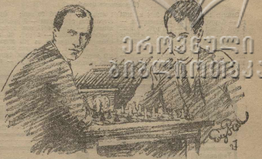
Ориг. рис. амер. худ. Ю. Поттера для москвит. журнала «64».