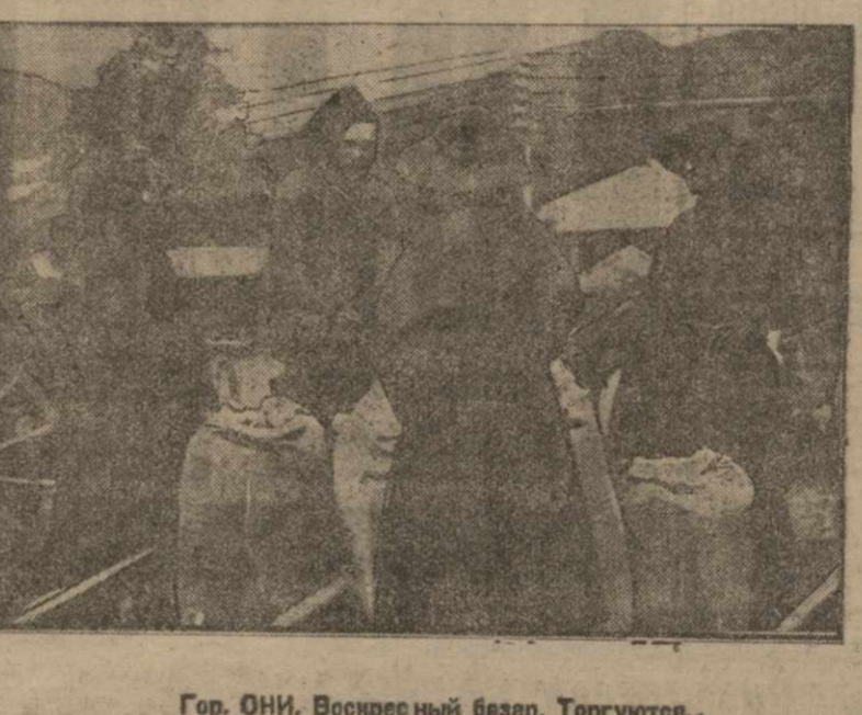
Гор. ОНИ. Воскресный базар. Торгуются...