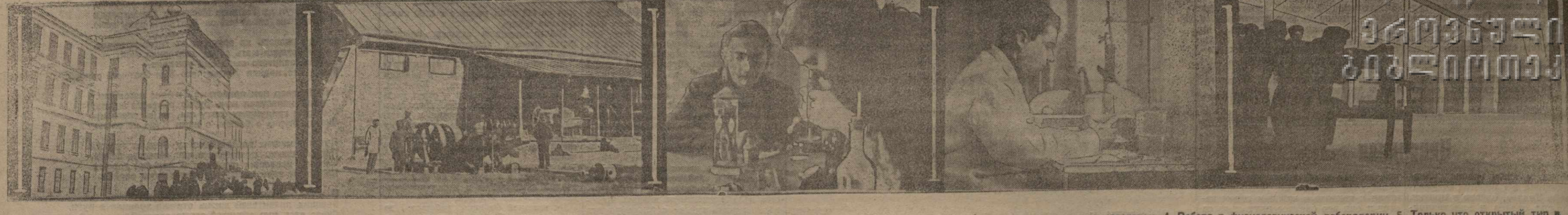
1. Здание университета. 2. Мухранское имение, принадлежащее университету; в этом имении студенты агрономического факультета проводят летнюю практику. 3. В зоологической лаборатории; занятия с микроскопом. 4. Работа в физиологической лаборатории. 5. Только что открытый тир.