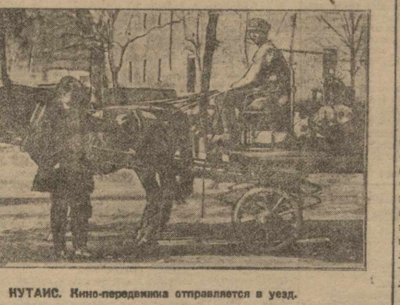
НУТАИС. Кино-передвижка отправляется в уезд.