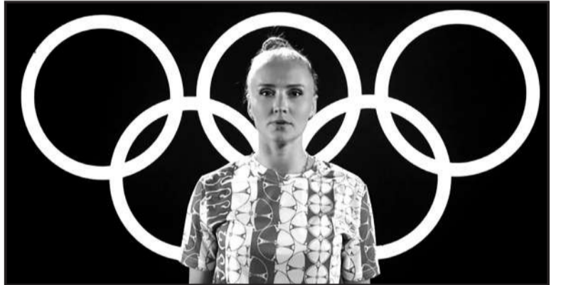
კვალიფიკაციაში 56.720 ქულით პირველი იყო ინდივიდუალურ ბტომებში ტოკოს ოლიმპიური თამაშების გამარჯვებული, გუნდურსა და სინქრონულში მსოფლიოს ხუთგზის ჩემპიონი ჩჟუ სიუიუი (ჩინეთი), თუმცა მან გადამწყვეტი ორთაბრძოლებისას პოზიციები ვერ შეინარჩუნა და სამოლოდ უმედლოდ დარჩა. ჩემპიონობა 56.480

ქულით 33 წლის ინგლისელმა ბრიონი პეტიმ მოიპოვა, რომელსაც აქამდე ოლიმპიური თამაშების ვერცხლისა და ბრინჯაოს ჯილდოები ჰქონდა და მსახურებელი, ხოლო მსოფლიოს ჩემპიონატების 4 ოქროს, ამდენივე ვერცხლისა და 3 ბრინჯაოს მედლის მფლობელია.