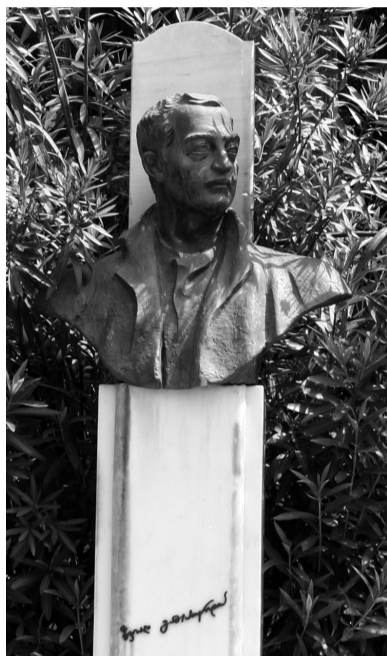
რა ბედნიერი კაცი ხარ! (ზვიად გამსახურდიას)

შენზე ლეგენდა-თქმულებამ იმატა, არ კი იკლო, რა ბედნიერი კაცი ხარ, მართლა მკვდარიც რომ იყო; შენ, მართლა მკვდარიც რომ იყო, უმალ დაშვების თვალი, მანაც არასდროს მოკვდები, იმგვარი დაგრჩა კვალი; მართლაცდა, მკვდარიც რომ იყო, უმალ დაგინყდეს მტრები, კოჭამდე ვერ მოგწვდებიან ერთად ცოცხალი მკვდრები. სიტყვას ვერ ამბობს ვერავინ შენი ხსენების გარე... ხან კარგად გაგიხსენებენ ხან გაურევენ მწარეს; გვერდს ვერ აგივლის ვერავინ, თუმც არ გელევა მტერიც, „ცუდას რად უნდა მტერობა,“ — მთავარი არის ერი... ერი კი მისდევს შენს გზას და, არცა ეგების სხვაგვარ... სიკვდილი რაა... — ადგომა ერთ დღეს და წასვლა სხვაგან... შენ კი არც არსად წასულხარ, აქ ტრიალებ და აქ ხარ, სად გინდა იყო, მეფურად შენს სამშობლოში დახვალ; აღტაცებულა უკვდავი შენი იდეით ყოვლი... შენს სახელს იმეორებენ სიყვარულით და თრთოლვით; მიტომაც, შენზე ლეგენდამ იმატა, კი არ იკლო... და ბედნიერი კაცი ხარ, მართლა მკვდარიც რომ იყო! ბელა შალვაშვილი