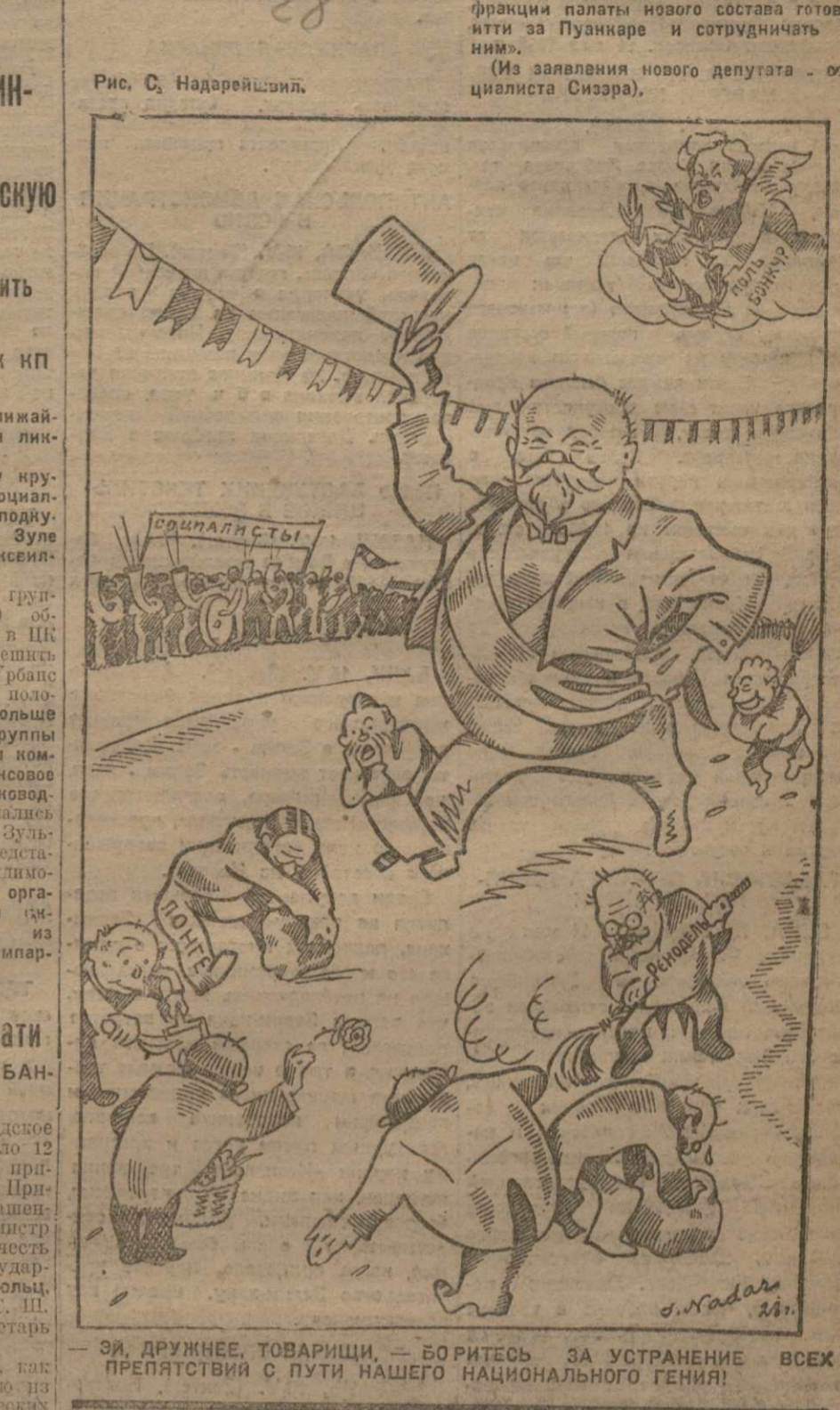
Рис. С. Надарейский. «Полдня членов социалистической фракции палаты нового состава готовит ити за Пуанкаре и сотрудничает с ним».