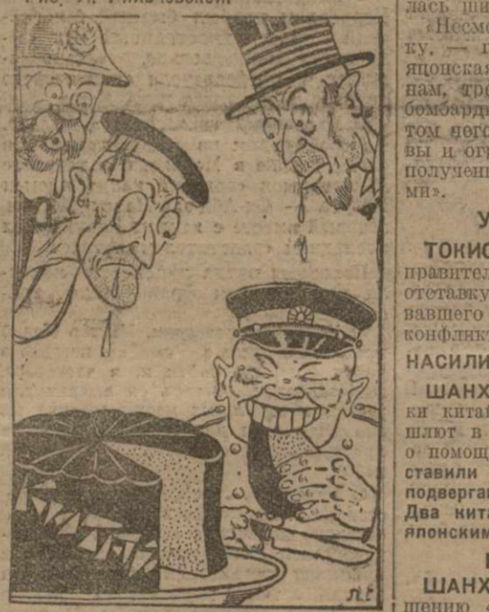
Рис. Л. Гильберсон. Франция, Англия и Америка хороши — «Как бы он не сел воле?»