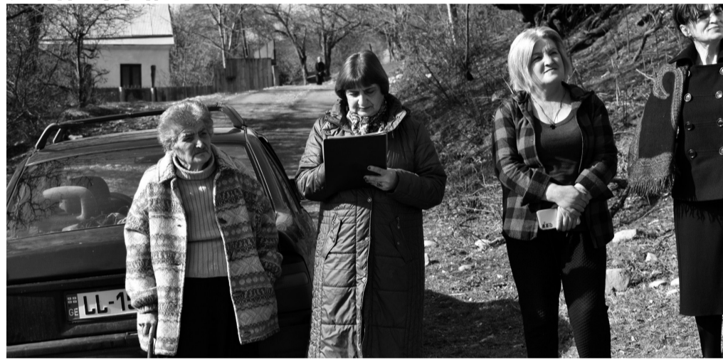
„სოფლის მხარდაჭერის“ პროგრამის ფარგლებში, საგარეჯოს მუნიციპალიტეტისთვის 668 000 ლარია გამოყოფილი.