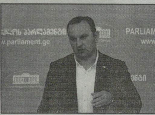
უმცირესობებთან დაკავშირებული პრობლემები არ არის. ეს არის შემოტანილი რიტორიკა იმისთვის, რომ თითქოს უსწრაფიანი ტრადიციების დამცველები და სხვა ვინც ამბობს, რომ ადამიანის უფლებები უნდა დაცვა და არ უნდა ჩაქოლო ქუჩაში, არის პროპაგანდის მომხრე, – განაცხადა მანჯგალაძემ.

თული ოცნების“ ღირებულებებს შორის. მათ უნდათ საქართველო რუსეთის ჩრდილქვეშ და მე მინდა მზის ქვეშ – ღარიბაშვილი გვთავაზობს რუსეთის ჩრდილ, ჭაობსა და რუსული გავლენის გაზრდას საქართველოში, – განაცხადა მანჯგალაძემ. ამასთან, როგორც მან აღნიშნა, ღარიბაშვილის განცხადებები ფსევდო-რელიგიური და ყალბი იყო. – ეს არის იაფფასიანი პოპულიზმი ჩემთვის. ფსევდორელიგიური და პატრიოტული სახარების ციფრებით გამოსული ღარიბაშვილი, ასლა გაასხენდა და აქამდე არავის უხსენებია, რომ „ნეტარ არიან მშვიდობისმყოფელი“. 9 ნეტარებიდან არის ეს და იქვეა „ნეტარ არიან სიმაღლისთვის მებრძოლი“. რატომ არ ილაპარაკა სიმაღლისთვის მებრძოლებზე? ესაა ფარისევლობა. ფრიდონ ინჯიას დასაცავი 2000–წლიანი კულტურის ქვეყანას არაფერი აქვს და არანაირი გენდერის პრობლემა არ დგას საქართველოში, არანაირი სექსუალურ