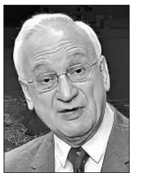
ნურბაზრ ბ. რუსნადი.

„ყოველწლიური მსოფლიო მშვიდობის ფორუმი საქართველოში“!