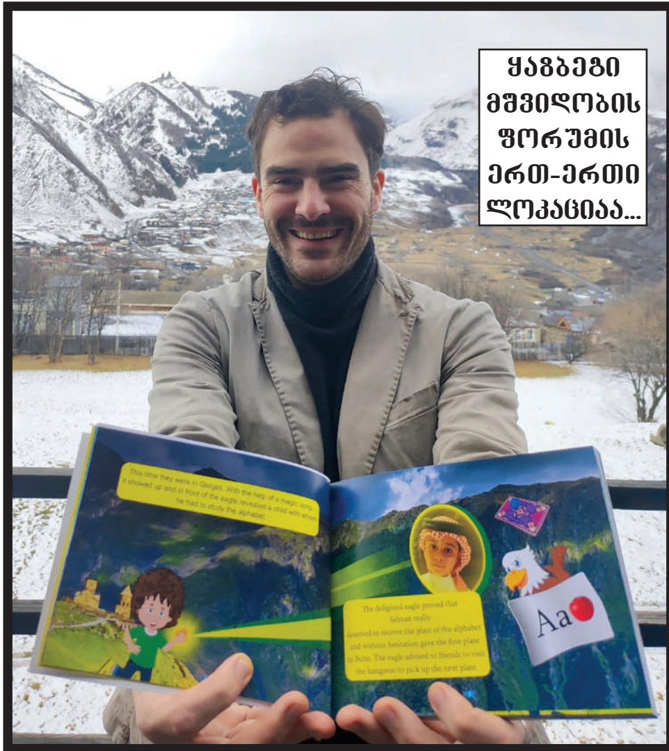
ყაზბეგი მშვიდობის ფორუმის პრემიის ლოკანია...

ეს მეთოდი ბავშვებს აყვარებს წიგნს და კითხვას, ამოგზავრებს საქართველოში,