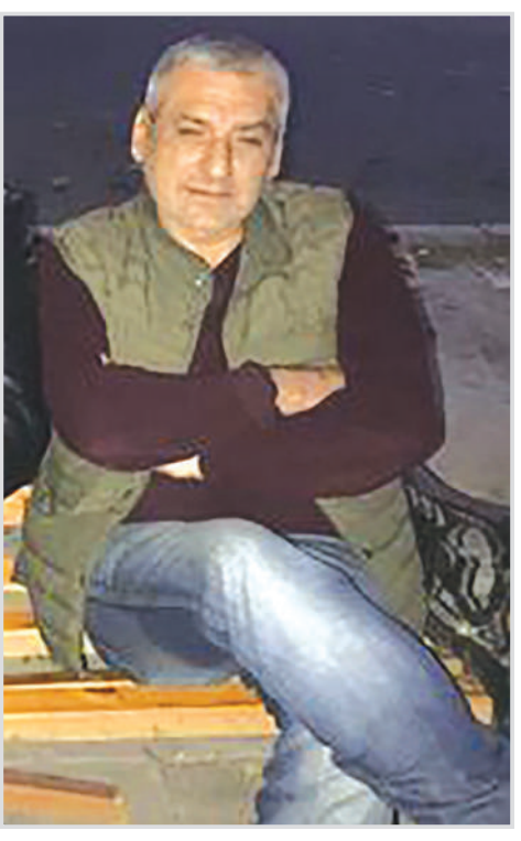
გიორგი ლიას, სათქმელი დამრჩა, თუ აღწევს უფროდ შტაფან ცვაიზის ნოვლის „უცნობი ქალის წერილით“ მცხოვროვდი, ახლა მიხვდები, რომ მარკვისი უფრო მეტი ყოფილა ჩემი არსებობისთვის... ცვაიზი ცოტას მოცდის...“

აქვე რამდენიმე ამონარიდს მოვიყვან მომავალი წიგნიდან: „რაც შეეხება, თუ რა ვითარება ჩემს ლაშქარს 14 აგვისტოს, დიდხანს ვიზრუნებდი, ახლა ცნობილი ადამიანების გვერდებზე ვითხოვ, თითქმის გაბრუნებულ ვაჟს ჩემს გადარჩევად მისცხონოვნი, და აი გვინაღობი მარკვისი – „ღის სიმცხლე, რათა მოგაგალო მოყვებ“. სწორედ ამ დროს გაბახანდა, ერთ-ერთ საფლავში გადამცხვამო რომ ვთქვამ, და თანაც ვამბობდი – ჩემთვის უკვე სიმცხლე აღარ ღის, უარყოფა ყველაფერი... და აი, მარკვისი, რომელმაც თითქმის პასუხი გასცა ჩემს სიმცხვამ... უცნაო ფურცელი მოვიმარჯვებ და ჩემს ლაშქარს დაგვრჩავ – იქნებ კვლავ დამრჩა რამე სათქმელი, ჩემო