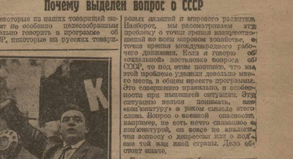
Делегат конгресса Коминтерна т. [Имя]

Вопрос о СССР имеет исключительное значение для нашей партии.