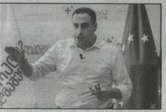
ალტერნატიული მარშრუტი არ უნდა შეიქმნას. უკრაინაში ომის შემდეგ რუსეთი მოექცა სანქციებში და მთელი ეს ტვირთნაკადი შეიძლება წამოვიღოთ საქართველოსკენ, 38 ტრილიონის

რი კონცეფცია, რომელიც ფაქტობრივად უკვე რეალიზებაში იყო ჩაშვებული, ლაზიკა-ანაკლიის პროექტის სახით. სწორედ თქვენი მტრული დამოკიდებულებიდან გამომდინარე, თქვენ გააჩერეთ ეს პროექტი. ეს იყო რუსული დავალება, რომელიც თქვენ პირნათლად შეასრულეთ. ლაზიკა-ანაკლიის პროექტი ითვალისწინებდა ღრმანწყლოვან პორტს, სანარმოო ცენტრებს, ლოჯისტიკურ ცენტრს, ტურისტულ ზონას, ფინანსურ-ტექნოლოგიურ პარკს. 300.000 მაღალანაზღაურებადი სამუშაო ადგილი იქნებოდა ახლა საქართველოში, შექმნილი რომ არა თქვენი მავნებელი, რუსული დავალებით შესრულებული ქმედებები.