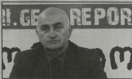
ბის დროს თავის მიზნებს ძალდაუტანებლად მიაღწია.

გეოპოლიტიკური პრობლემები აფხაზეთს განსაკუთრებით ეხებოდა. ამდენად, რუსეთმა ამ რეგიონში 1992-93 წლების საომარი მოქმედებე-