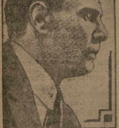
Шариф - заде