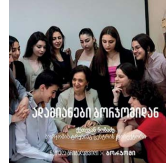
ბორჯომის ტრენინგ ცენტრის სემინარი.

„ჩემი ოცნება იყო, შემეძინა არაფორმალური განათლების ცენტრი, რომელიც იქნებოდა უფასო და ყველა მოსწავლისთვის ხელმისაწვდომი. კომპანია „ბორჯომის“ დახმარებით, ეს ოცნება რეალობად იქცა. 10 წლის განმავლობაში ბორჯომის ტრენინგ ცენტრში, 5000-ზე მეტმა მოსწავლემ მიიღო განათლება და თავის ინტერესის მიხედვით, სხვადასხვა კლუბში გაერთიანდა. ბორჯომის ტრენინგ ცენტრი საოცარი მაგალითია იმის, თუ როგორ შეიძლება ერთად იზრუნონ მომავალი თაობის აღზრდა-