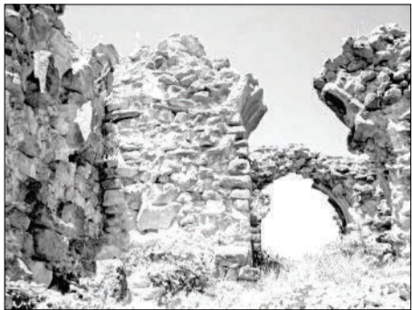
„არს მთის კალთას, სკანდას, სასახლე მუყეთა და ციხე დიდი, დიდშენი“ პასუხი პაპრატიონი