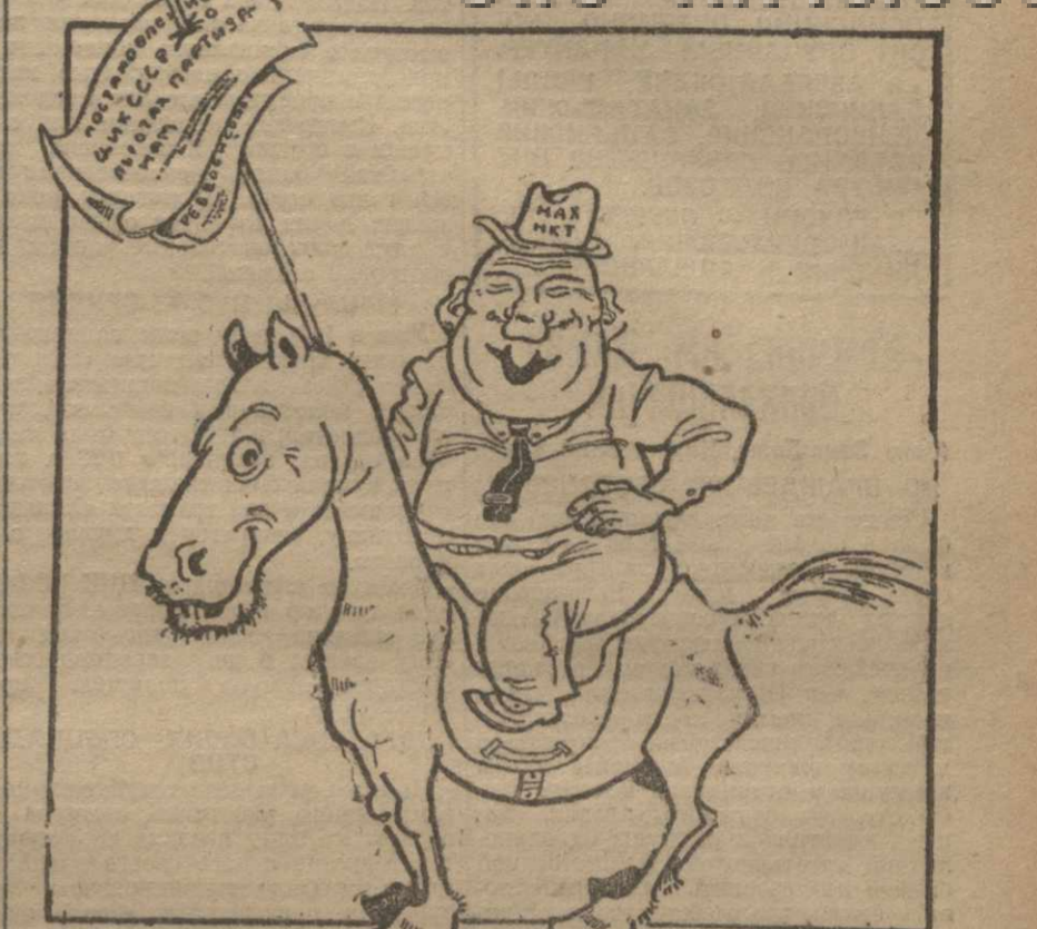
Так паркоматрица Нах. ССР разрешил вопрос о льготах красным партизанам.