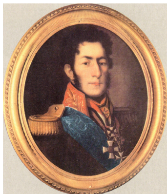
Генерал от инфантерии Пётр Багратиони