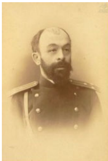
Георгий Орбелианов (Орбелиани)

лотой саблей и орденом Святого Станислава 1-ой степени с мечамию