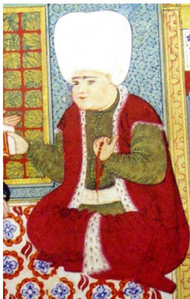
Гурджи Мехмед-паша I

период головокружительного возвышения на государственном поприще. Сначала он был от- правлен на должность правителя (вали) Египта, где ему удалось внести весомый вклад в деле упрочения османской власти, после чего отправляется в Ру- мелий (европейская часть Ос- манской империи) в качестве правителя этой провинции, затем назначенный на пост бегларбега (правителя) Босний, успешно за- нимается укреплением и защитой границ Белграда и Дунайского побережья.