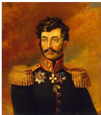
Генерал-майор Роман Багратиони