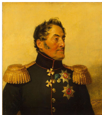
Генерал артиллерии Леван Иашвили (Яшвиль)