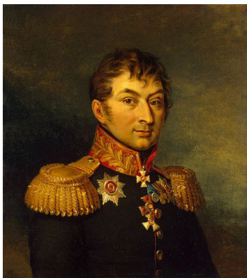
Генерал-майор Иван Панчулидзе (Панчулидзе)