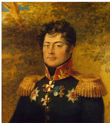
Генерал-майор Семён Панчулидзе (Панчулидзе)