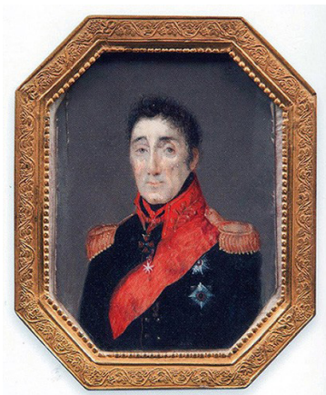
Генерал-лейтенант Семён Салагов (Сологашвили)