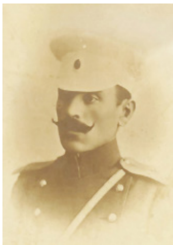
Георгий Мазниев (Мазниашвили)

В русско-японской войне участвовал командующий грузинской армией первой Грузинской республики, генерал от инфантерии с 1917 года, Илья Одишелидзе и за проявленное мужество был награжден высокими орденами. Следует отметить, что в 1917 году он исполнял обязанности главнокомандующего Кавказской армии.