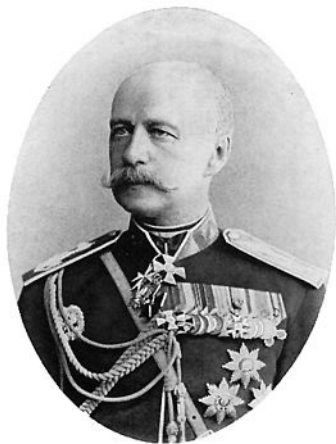
Александр Багратиони (Имеретинский)

До начала войны у России и Османской империи были разные стратегии, из-за чего исключительное геополитическое значение Грузии стало актуальным для противоборствующих держав. Османы хотели воевать не в Европе, а на Кавказском фронте. Расквартированный в Батуми корпус Дервиш-паши должен был двинуться на Кутаис, а поддерживаемые османами народы Северного Кавказа должны были поднять восстание в тылу. По плану турок, русские войска, стоящие на Кавказе, должны были оказаться между двух огней, вместе с турецкой армией на них должны были напасть горские народы. Османский флот должен был из Чёрного моря войти в Азовское и отрезать путь русской армии к отступлению. По российскому плану атака должна была развиваться по четырем направлениям: от Озургети в сторону Батуми, от Ахалцихе к Ардагану, от Александрополя к Карсу и от Эривана к Баязету. Для успешного завершения войны решающее значение имело взятие таких стратегически важных крепостей, как Карс, Ардаган, Баязет и Эрзэрум. В войну должны были вступить не только грузинские солдаты и грузинская милиция, но и население региона. Тем более, что борьба грузинского народа за возвращение своих исторических территорий полностью совпадала со стратегическими интересами России в этой войне. У грузинского народа, в русско-османской войне 1877