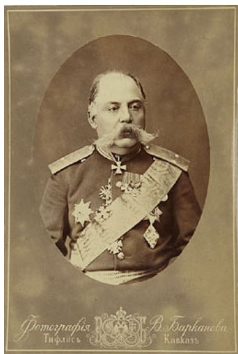
генерал-лейтенант Яков Алхазов (Алхазидшвили)

Российское командование кавказским фронтом, по плану, начало наступление по четырем направлениям: от Озургети к Батуми, от Ахалцихе к Ардагану, от Александрополя к Карсу и от Эривана к Баязету. Решающее значение имело взятие стратегических крепостей – Карса, Ардагани, Баязета и Эрзерума. Грузины были особенно активны на кавказском фронте. Кавказский фронт развернулся на территории Малой Азии, Аджарии и юго-западной Грузии. Здесь себя проявил генерал-лейтенант Яков Алхазов (Алхазидшвили), при взятии