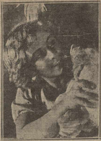
Кадры из картины «Скорый № 2».