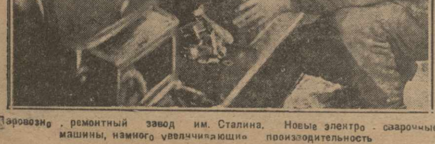
Порозови, ремонтный завод им. Сталина. Новые электро-защитные машины, много увеличивающие производительность.

Хозяйственные затруднения преодолеем В заключение конференции было принято решение о проведении систематического инструктирования парторганизаторов. Это позволит им лучше ориентироваться в своей работе и выполнять ее качественно.