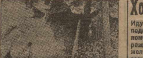
Рион-ГЭС. Вход в новооткрытую станцию гидро-электростанции.