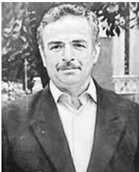
სადმი გონიერ დამოკიდებულებას ასწავლიდა.

ქედის რაიონის სოფელი ჯალაბაშილები წინა საუკუნის ბოლო წლებში 90-ზე მეტ მოსახლეს ითვლიდა. მეწყრული თუ ურბანული პროცესების გამო, სოფელი ნაწილობრივ დატოვდა. თუმცა არიან და იქნებიან ისეთებიც, რომლებიც ადგილის დედას გამოჩენულად ეფერებიან, საკუთარი მარჯვნივ ქვეყნისთვის დოვლათს ქმნიან