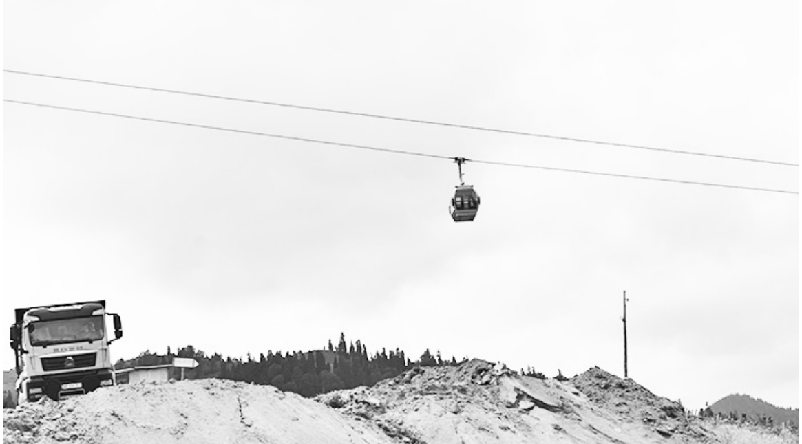
ბათუმი-ახალციხის საავტომობილო მაგისტრალი ხელს შეუწყობს ტვირთების გადაზიდვასა და მოსახლეობის უსაფრთხო გადაადგილებას.