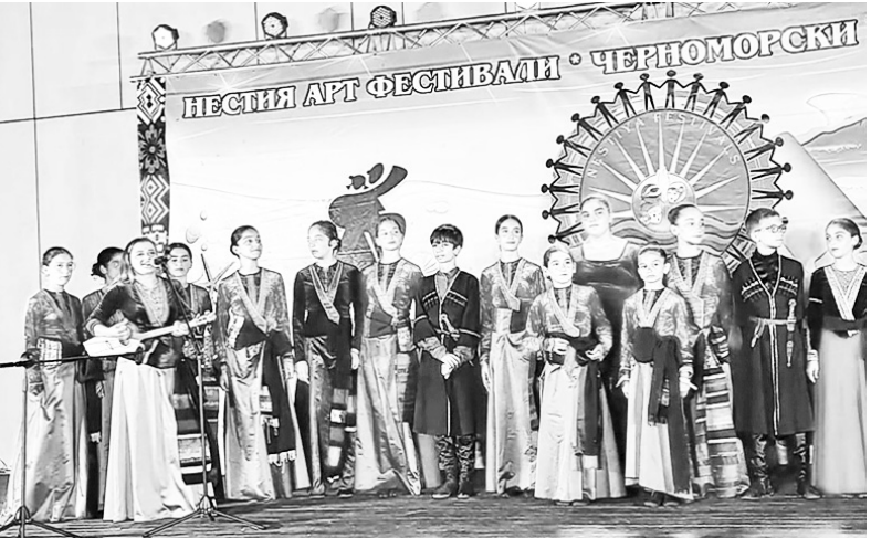
და სპორტის სამინისტრომ და ქედის მუნიციპალიტეტის მერიამ დააფინანსა.

ფოლკლორული ანსამბლი „ჩანგის“ ნესებრში გასტროლი აჭარის განათლების, კულტურისა