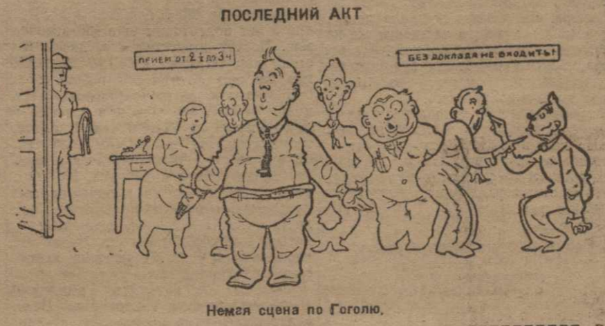
Немел сцена по Гоголю.

Как передают, о большом подвиге... (Text repeats the story about the workplace achievement)