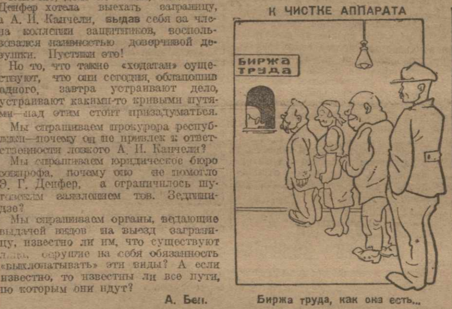
Биржа труда, как она есть...