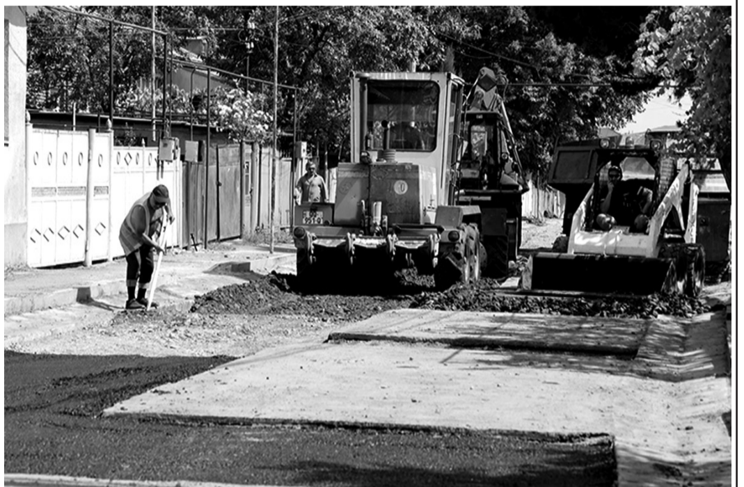
დასრულდება მიმდინარე წლის ბოლომდე.

რაც ეხება ქალაქ ხაშურის ქუჩების მოწესრიგებას, მუნიციპალიტეტში მიმდინარეობს პროექტირების სამუშაოები და მომავალი წლიდან ყველგან, სადაც წყალგაყვანილობისა და წყალარინების სამუშაოები დასრულდება, დაიწყება ქუჩების მოასფალტება. ყაზბეგისა და დადიანის ქუჩების მოასფალტება კი დაიწყება წელსვე, უახლოეს პერიოდში და