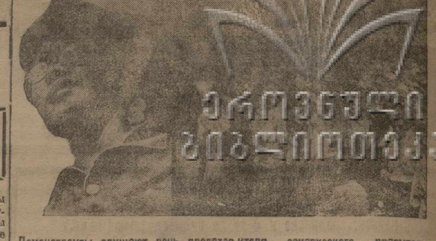
Демонстранты слушают речь председателя закавказского правительства

Колонны демонстрантов проходят перед зданием дворца