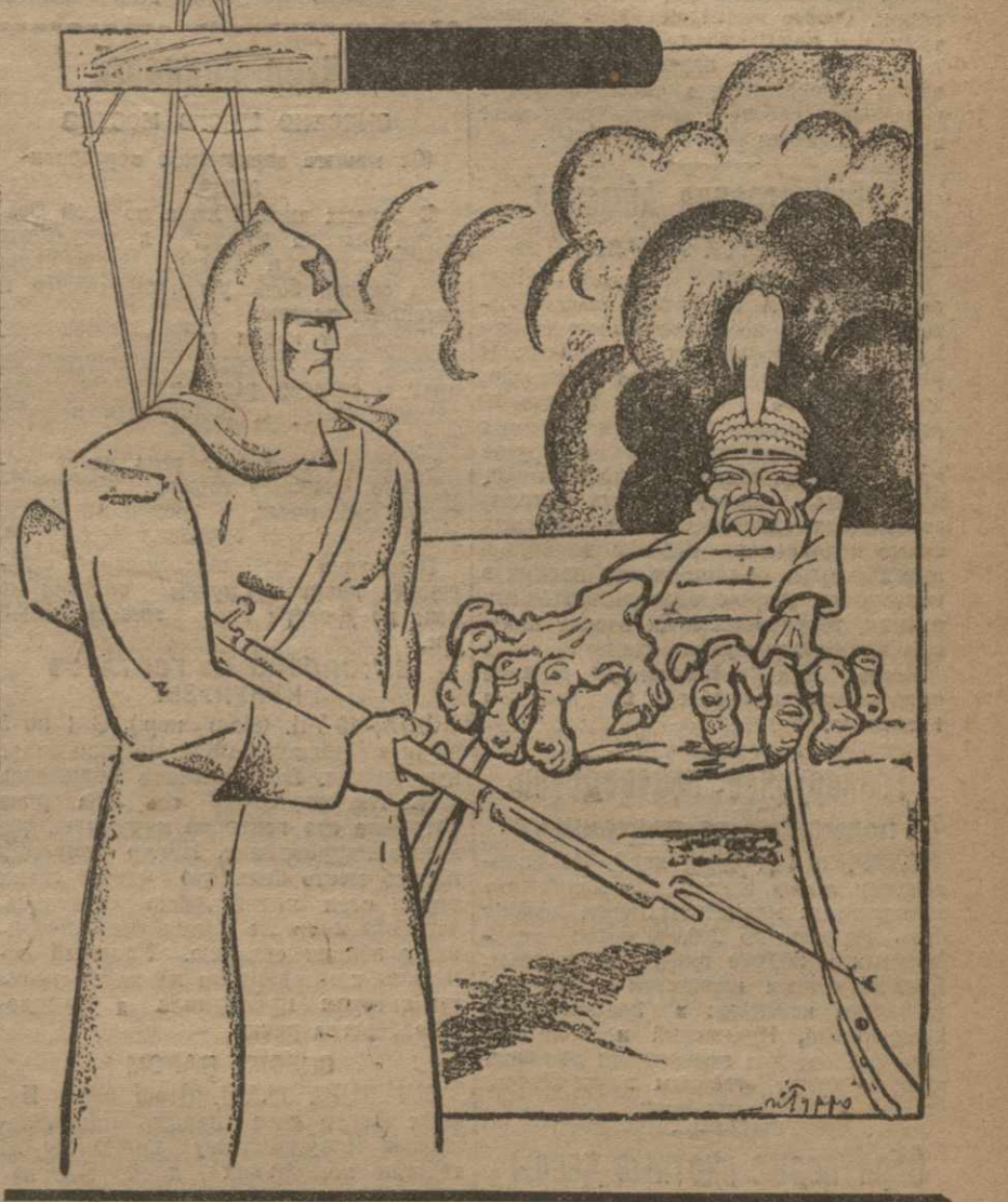
КВЖД и всем советским вопросам, но дружба его остается твердой.

Демонстрация протеста в Тифлисе. Вечером 17-го июля в Тифлисе состоялась демонстрация протеста против захвата КВЖД.