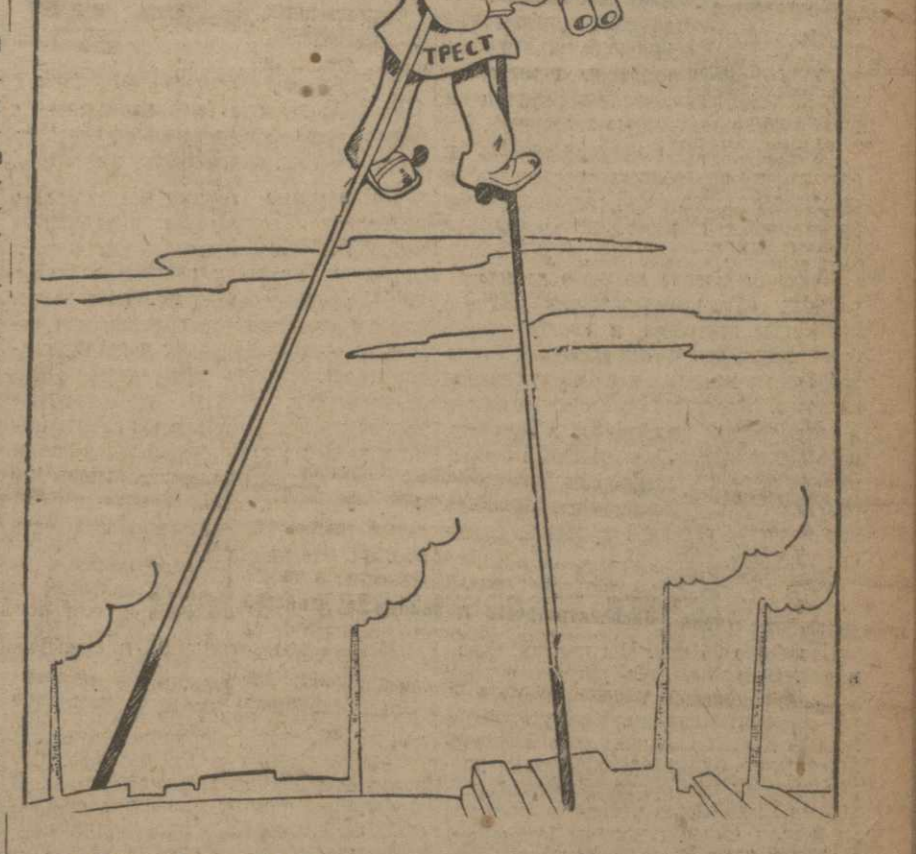
РАБОТНИК ТРЕСТА: А ну взгляни, что на наших заводах делается!

Некоторые тресты очень слабо обслужены с экономической точки зрения. Рис. И. Гурро.