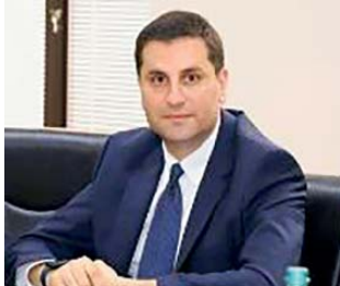
ძვირფასო ბორჯომელებო, გილოცავთ ბორჯომ-ქალაქობას!

სახელმწიფო რწმუნებული სამცხე-ჯავახეთის მხარეში