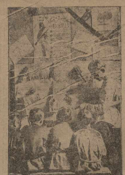
В свободное от занятий время школьники изучают военное дело под руководством инструктора