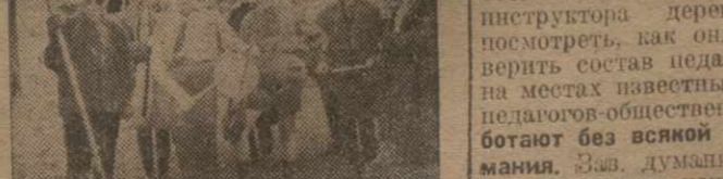
Пioneры — за грамоту.

В Агбулахском районе найдено полуразрушенное здание в двух комнатах. Потолок протекает — в первую очередь надо заняться крышей.