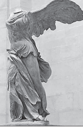
„ნიკე სამოთრაკიელი“, II საუკუნე ჩვენს ერამდე

მკვლევარებს მიაჩნიათ, რომ უცნობმა მოქანდაკემ შექმნა „ნიკე“ II საუკუნეში ჩვენს ერამდე ბერძნების საზღვაო გამარჯვებათა აღსანიშნავად. ღვთაების ხელები და თავი დაკარგულია სამუდამოდ. არაერთგზის შეეცადნენ აღედგინათ ხელების თავდაპირველი მდგომარეობა. ვარაუდობენ, რომ მალა ანეულ მარჯვენა ხელს უჭირავს თასი, გვირგვინი ან ბუცი.