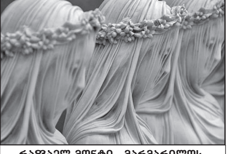
რაფაელ მონტი. „მარმარილოს ვუალი“, 1513-1515 წლები

ლოდს, რომელიც უნდა გამოიქონოს, უნდა ჰქონებოდა ორი ფენა – ერთი უფრო გამჭვირვალე, მეორე უფრო მკვრივი. ძნელია ასეთი ბუნებრივი ქვების მოძებნა და ნახვა, მაგრამ ისინი არის. ოსტატს გონებაში ჰქონდა სიუჟეტი, მან იცოდა, კერძოდ, როგორი ლოდი უნდა ექებონ.