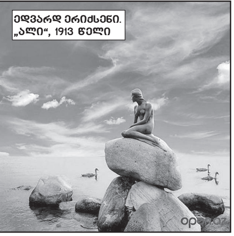
ედვარდ არიხსენი. „ალი“, 1913 წელი

ვანდალებს. მეტად მძაფრი იყო მისი გაჩენის ისტორია. იგი მრავალჯერ დაამტკიცეს და დახერხეს ნაწილებად. ახლაც შეიძლება აღმოაჩინო მისი ოდნავ შესამჩნევი „ნაჭრეები“ კისერზე, რომლებიც გაჩნდა იმის აუცილებლობის გამო, რომ შეეცვალათ ქანდაკების თავი.