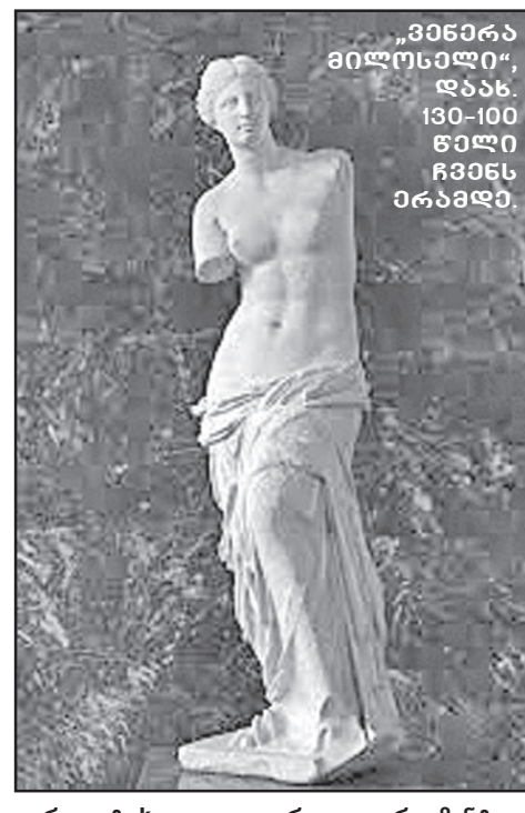
„ვენერა მილოსელი“, დაახ. 130-100 წელი ჩვენს ერამდე.

ვენერას ფიგურას პარიზის ლუვრში საპატიო ადგილი უკავია. ვილაც ბერძენმა გლეხმა იგი 1820 წელს მილოსის კუნძულზე აღმოაჩინა. აღმოჩენის დროისათვის ფი-