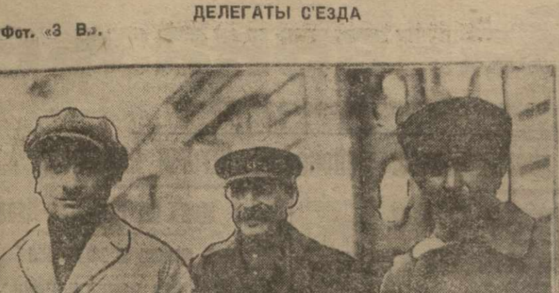
Фот. «3 В.» ДЕЛЕГАТЫ СЪЕЗДА

Итак, что же является истинной базой партии, для ее руководителей органы, до должно быть непременно выстроены под сенью нашей оппозиции.