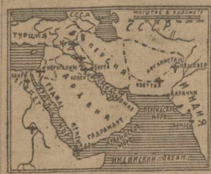
Военно-воздушная подготовка империализма на Ближнем Востоке

Как известно, главными направлениями вооружения являются Ближний Восток, Индия, Австралия и Южная Африка. В последние годы империализм усиленно занимается подготовкой к войне в этих районах. В частности, в Индии и Китае мы не нуждаемся в помощи империализма. В Индии и Китае мы не нуждаемся в помощи империализма. В Индии и Китае мы не нуждаемся в помощи империализма.