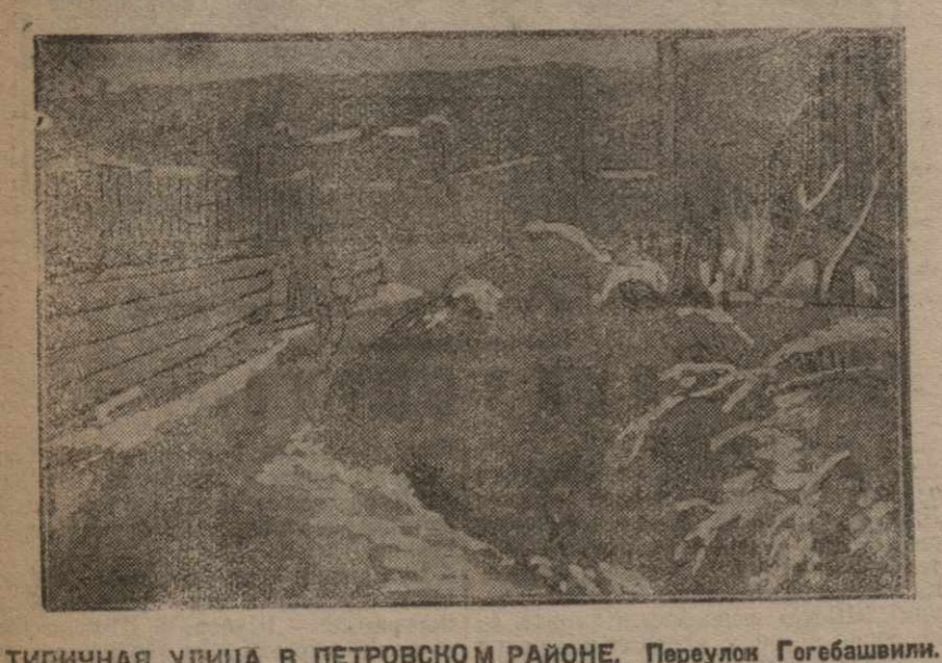
Типичная улица в Петровском районе. Перулон Гогобашилы.