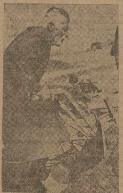
С. КАСАНИ. Колхозник на вспашке поля