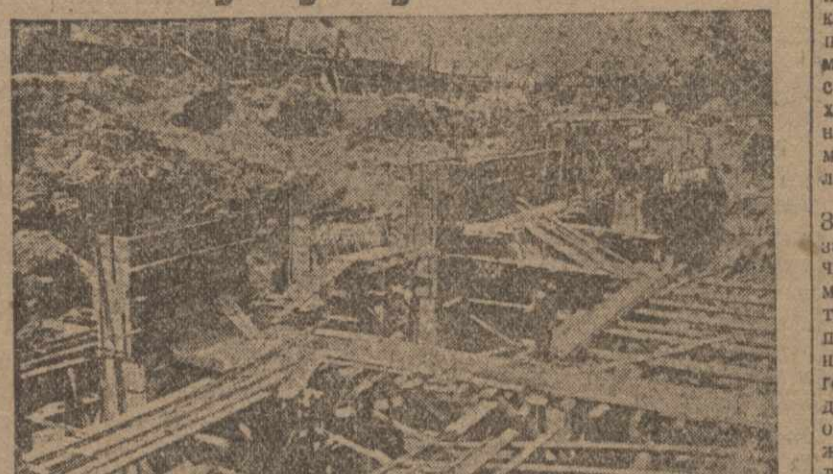
Дорогостройки главного машинного здания гидроэлектростанции.

В каждой стране, — говорит Ольберг, — вкладываются большие капиталы на создание энергетического хозяйства, которое дает большие доходы. В Канаде и США, где