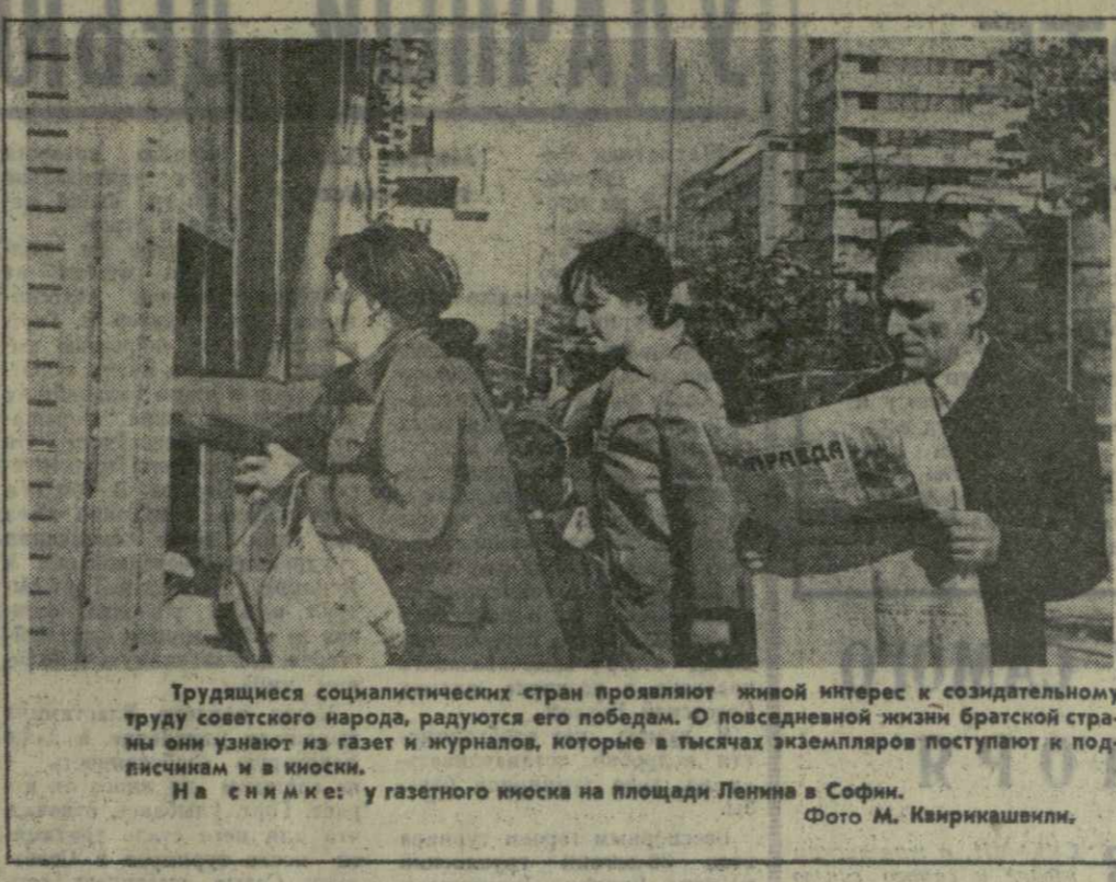
Трудящиеся социалистических стран проявляют живой интерес к созидательному труду советского народа, радуются его победам. О повседневной жизни братской страны они узнают из газет и журналов, которые в тысячах экземпляров поступают к подписчикам и в киоски. На снимке: у газетного киоска на площади Ленина в Софии.

До съезда мы хотим ориентировать партию на главные позитивные политические цели. Партия является руководящей политической силой в нашем обществе, ее внутренняя консолидация является предпосылкой политической консолидации государства. Поэтому на проведение выборов нужно рассчитывать после съезда партии. Мы не будем начинать галопить эти сроки; однако в интересах успешного хода съезда и выборов мы не можем искусственно сокращать их. Развитие положения в этом году конкурентно укажет нам сроки для обеих кампаний. Вот почему мы также говорим, что 1970 год мы считаем годом завершения процесса консолидации в партии и в нашем обществе.