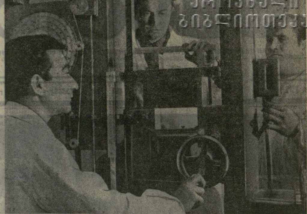
Изучение процесса прироста древесины, влияние светового режима на ее формирование и структуру, влияние различных физиологических процессов, а также физико-механические свойства различных древесных пород — это только часть работ, которыми занимается лаборатория анатомии растений и лесоводения при Тбилиском научно-исследовательском институте леса.

А. МИТАВАРИЯ, (Спец. корр. «Заря Востока»).