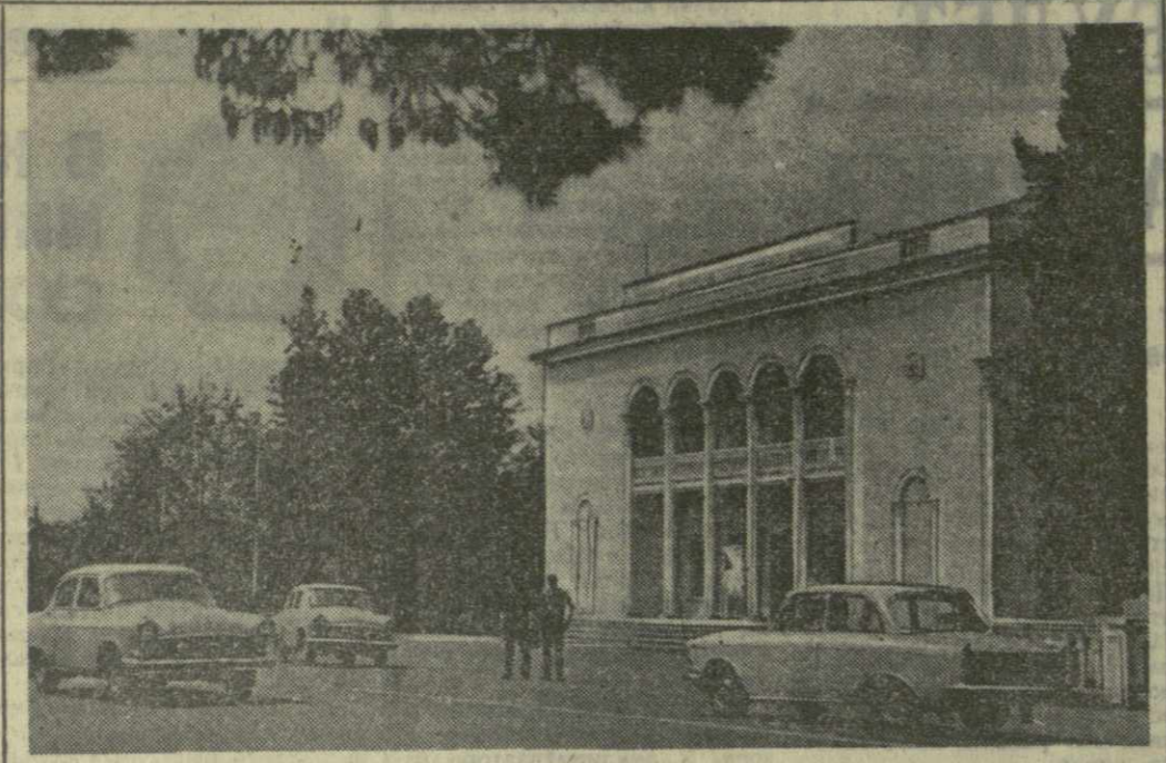
Гали. Районный Дом культуры.