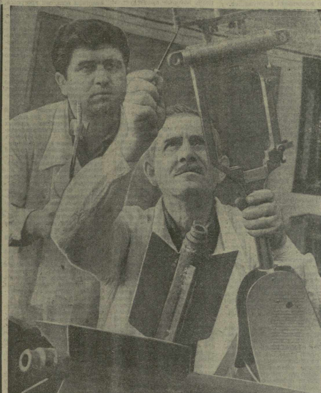
Коллектив тбилисского завода «Гидрометприбор» успешно несет Ленинскую трудовую вахту. Взяв повышенные обязательства, рабочие предприятия решили завершить пятилетний план к 7 ноября 1970 года.

Жить и бороться по-ленински — значит отдавать все силы, знания, энергию самому гуманному и справедливому делу на Земле — борьбе за полное освобождение трудящихся от гнета и эксплуатации, за победу коммунистических идеалов, за лучшее будущее человечества.