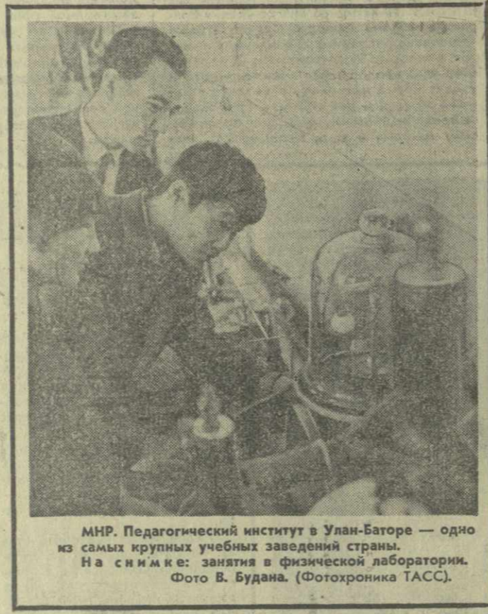
МНР. Педагогический институт в Улан-Баторе — одно из самых крупных учебных заведений страны. На снимке: занятия в физической лаборатории.

На закончившейся здесь двухдневной сессии совета министров, в которой принимали участие министры иностранных дел, финансов и сельского хозяйства «шестерки», практически не было принято никаких решений по основным вопросам повестки дня — так можно кратко резюмировать итоги сессии. Горячие споры в Брюсселе вызвала проблема наделения европейского парламента полномочиями при решении вопросов бюджета сообщества. С серьезными возражениями против предоставления европейскому парламенту особых прав в этой области выступила Франция. Напротив, Голландия и Италия упорно настаивали на ускорении решения этого вопроса.