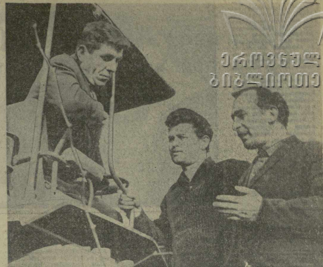
Механизаторы Варкентского виноградарского совхоза Гардабанского района наращивают темпы полевых работ. На виноградниках совхоза, занимающих 750 гектаров, проводится обработка междурядий, вносятся удобрения.