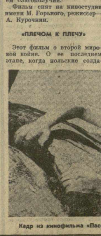
Кадр из кинофильма «Пассажир с экватора».