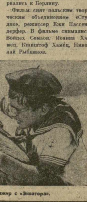
Кадр из кинофильма «Пассажир с экватора».