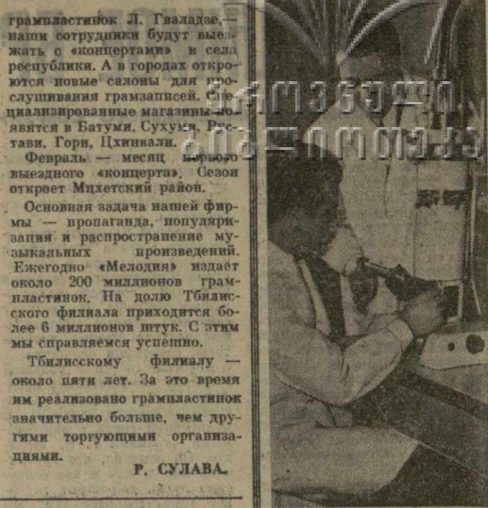
Давняя дружба связывает грузинских ученых с чешскими коллегами.

В нынешнем году, — продолжает свой рассказ директор Тбилисского Дома