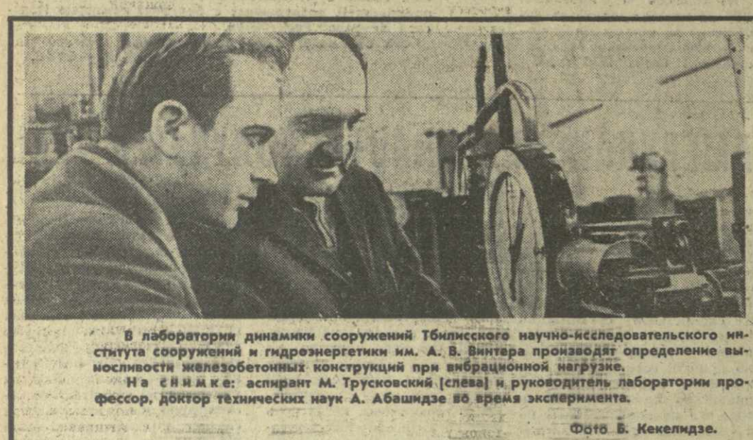
В лаборатории динамики сооружений Тбилисского научно-исследовательского института сооружений и гидротехники им. А. В. Винтера производят определение жесткости железобетонных конструкций при вибрационной нагрузке.

Тбилисский государственный академический театр имени Ш. Руставели. «Добрый человек из Сезуана» (в 3-х частях). Тбилисский государственный оперный театр. Трудности Красного Знамени академический театр имени К. Марксашвили. «Федра» (в 2-х частях). Театр музыкальной комедии имени В. Абашидзе. «Полдень Чаниты» (в 2-х частях, зрительный зал с 1-го по 6-й ряд).