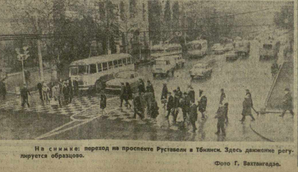
На снимке: переход на проспекте Руставели в Тбилиси. Здесь движение регулируется образцово.