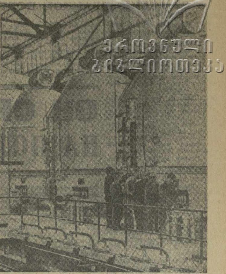
ЧССР. В городе Грохове-Тыце польские рабочие и инженеры построили один из самых крупных в Центральной Европе сахарный завод. Он будет перерабатывать за сутки 4 тысячи тонн сахарной свеклы. В ближайшее время в Чехословакию пойдут еще пять таких предприятий, возведенных с братской помощью Польской Народной Республики. На снимке: в цехе нового завода.

На днях корреспондент ТАСС посетил сельскохозяйственный производственный кооператив в общине Иеншо в пригороде Ханоя. Здесь трудятся и живут свыше 3 тысяч человек. Раньше этот район считался одним из наиболее бедных районов пригородной