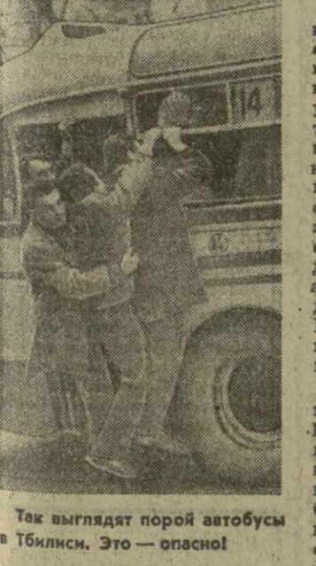
Так выглядят порой автобусы в Тбилиси. Это — опасно!

Ораторы говорили о всеобщей идее великих ленинских идей, высоко оценивая вклад Советского Союза в общее движение солидарности с народами, завоевавшими свою свободу и еще сражающимися против гнета империализма, подчеркивали огромные успехи национально-освободительного движения, которые стали возможны благодаря победе Великой Октябрьской социалистической революции, могуществу первой в мире страны социализма.