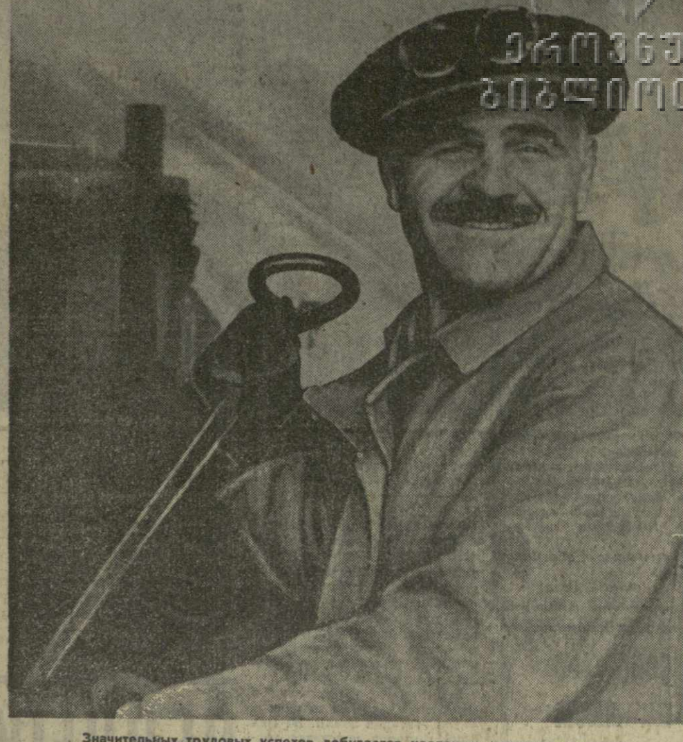
Значительных трудовых успехов добивается коллектив механического завода «Чигурмарганец». Уже пятый год он с честью носит почетное звание предприятия коммунистического труда. Только в минувшем году было выдано сверхплановой продукции на 911 тысяч рублей.