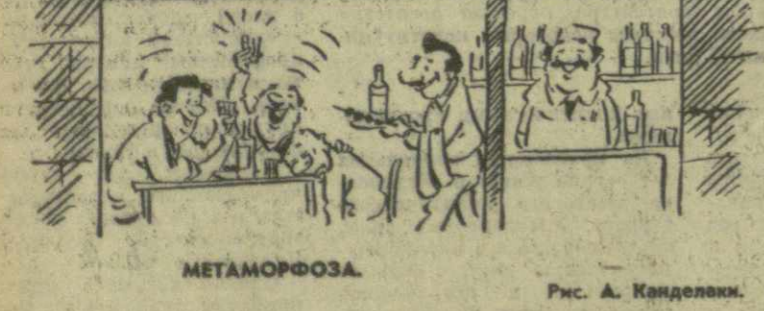
МЕТАМОРФОЗА. Рис. А. Канделак.