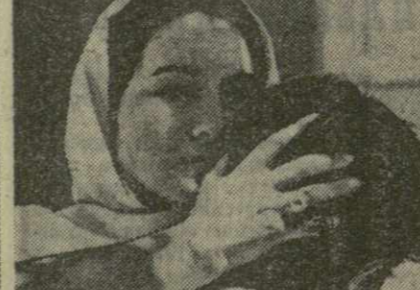
На снимке: кадр из кинофильма «Влюбленные».