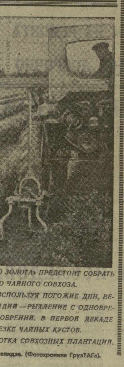
АБХАЗСКАЯ АССР. 1.300 ТОНН «ЗЕЛЕННОГО ЗОЛОТА» ПРЕДСТОИТ СОБРАТЬ...

Большое место в учебном плане отводится изучению вопросов партийной и советского строительства.