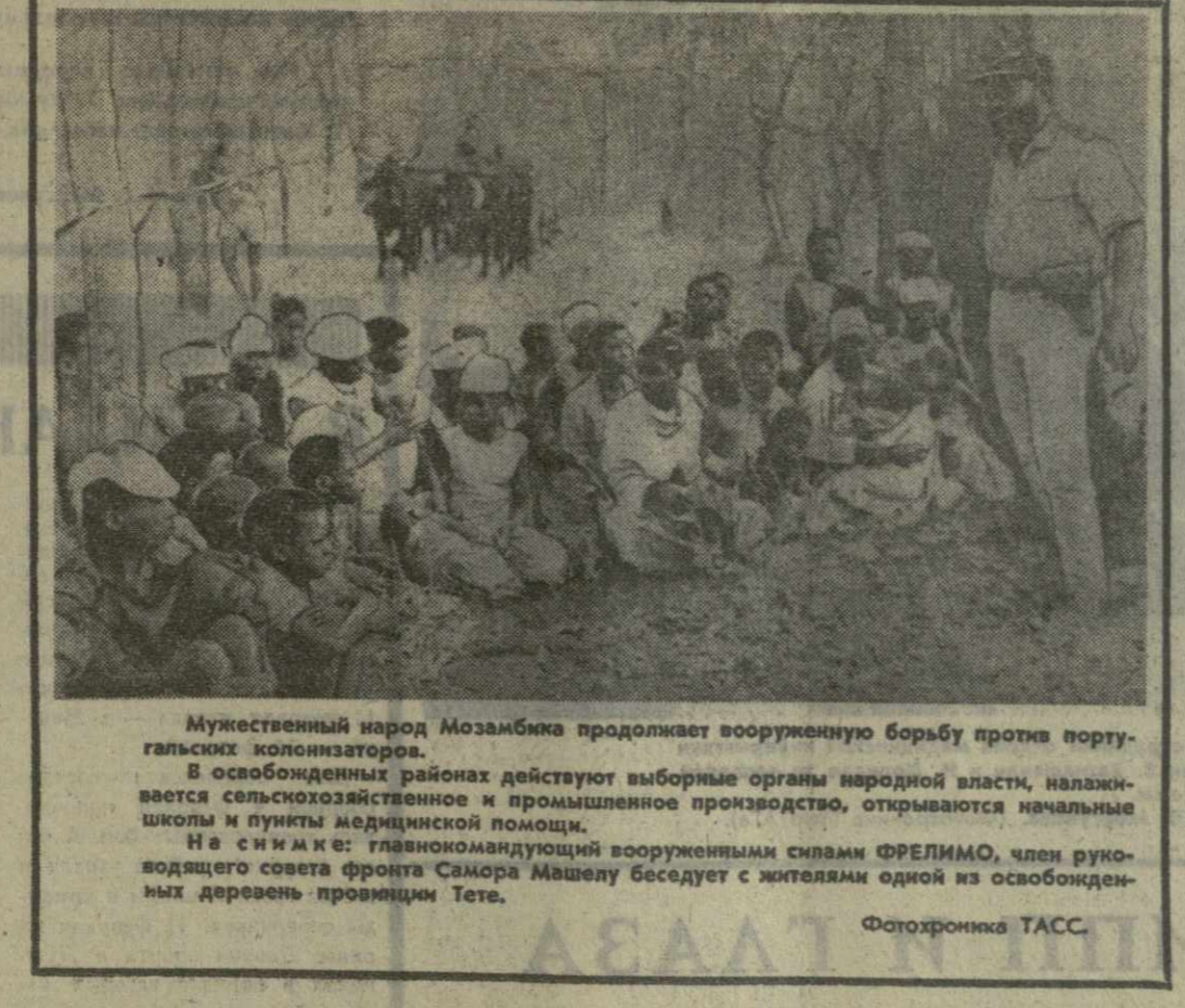
Мужественный народ Мозамбика продолжает вооруженную борьбу против португальских колонизаторов. В освобожденных районах действуют выборные органы народной власти, налаживается сельскохозяйственное и промышленное производство, открываются начальные школы и пункты медицинской помощи. На снимке: главнокомандующий вооруженными силами ФРЕЛИМО, член руководящего совета фронта Сажора Машелу беседует с жителями одной из освобожденных деревень провинции Тете.

ВАШИНГТОН, 5 февраля. (ТАСС). При попытке доставить в США большой груз наркотиков поймааны члены крупной мафии контрабандистов. Министр внутренних дел США сообщил, что преступники намеревались переправить в Соединенные