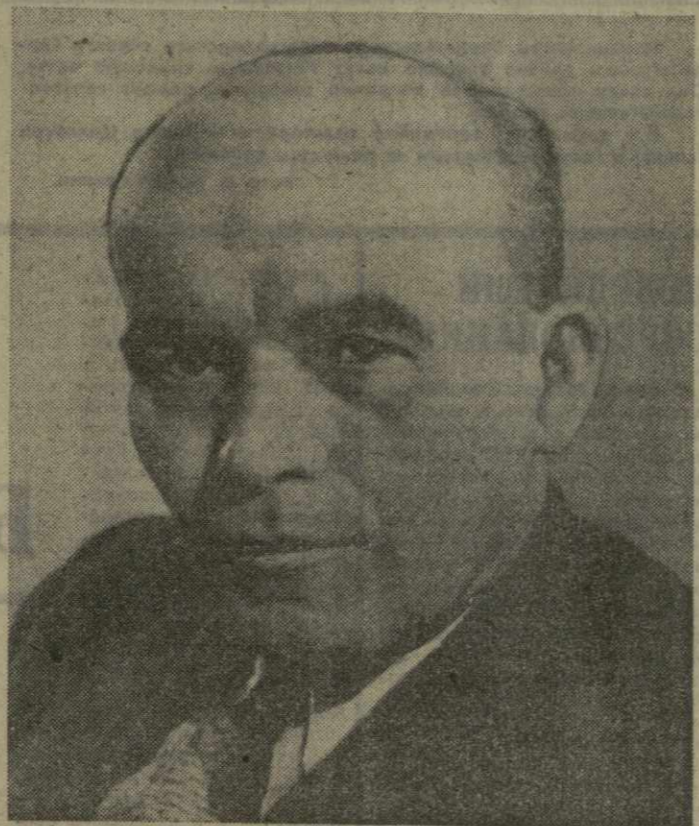
Первому секретарю ЦК Польской объединенной рабочей партии товарищу Владиславу ГОМУЛКЕ

Дорогой товарищ Веласла! В день Вашего 65-летия Центральный Комитет Коммунистической партии Советского Союза, Президиум Верховного Совета и Совет Министров СССР от души поздравляют Вас, выдающегося сына польского народа, стойкого борца за дело рабочего класса, за победу социализма в Польше. Мы знаем Вас, как большого друга Советского Союза, последовательного интернационалиста-ленинца и нашего соратника по борьбе за общие цели и идеалы, за сплоченность рядов коммунистов, за торжество коммунистических идей. Ваш вклад в укрепление братства и всестороннего сотрудничества между ПОРП и КПСС, между нашими странами высоко оценивается всеми коммунистами и трудящимися Советского Союза. В этот знаменательный день разрешите, дорогой товарищ Веласла, поздравить Вас крепкого здоровья и новых успехов в Вашей работе. Пусть Ваш богатый опыт, знания, энергия и вперед будут служить интересам польского народа, социалистического сотрудничества и всего международного коммунистического и рабочего движения!