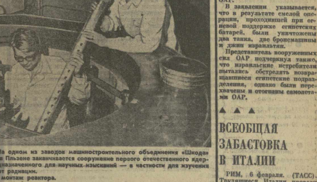
Чехословакия. На одном из заводов машиностроительного объединения «Шкода» имени В. И. Ленина в Пльзене заканчивается сооружение первого отечественного ядерного реактора, предназначенного для научных исследований — в частности для изучения проблемы защиты от радиации. На снимке: монтаж реактора.

Именно руководствуясь указанными принципами, мы предложили китайскому правительству начать переговоры, которые могли бы привести к урегулированию отношений между нашими государствами. К сожалению, в то время, когда идут переговоры в Пекине, все более раздувается в Китае злостная антисоветская кампания, нагнетается военный психоз. Но, несмотря на провокационные действия со стороны Пекина, подчеркивает А. П. Кирilenko, мы стремимся и будем стремиться нормализовать отношения между СССР и КНР, восстановить добрососедство и дружбу советского и китайского народов.