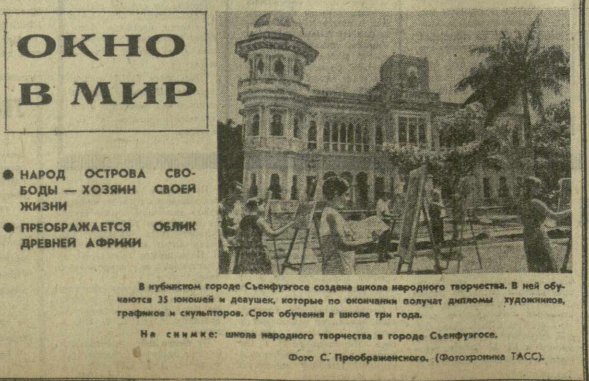
В кубинском городе Сеннар создана школа народного творчества. В ней обучаются 35 юношей и девушек, которые по окончании получат дипломы художников, графиков и скульпторов. Срок обучения в школе три года. На снимке: школа народного творчества в городе Сеннар.

● НАРОД ОСТРОВА СВОБОДЫ — ХОЗЯИН СВОЕЙ ЖИЗНИ ● ПРЕОБРАЖАЕТСЯ ОБЛИК ДРЕВНЕЙ АФРИКИ