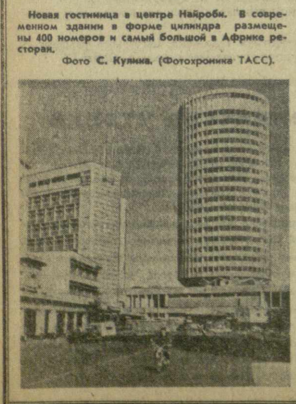
Новая гостиница в центре Найроби. В современном здании в форме цилиндра размещены 400 номеров и самый большой в Африке ресторан.

ПАРИЖ, 13 февраля. (ТАСС). В курортных районах Французских Альп создались тревожащая обстановка. Снежные лаваны вновь отрезали от внешнего мира местечко Валь д'Изер, где два дня тому назад в результате обвала погибло около 30 туристов. Снежные обвалы отрезали дорогу, ведущую на другой курорт — Тинь. 7 тысяч человек отрезаны от внешнего мира. В результате обвала погибли три человека. Обвалы произошли также в ряде других районов Французских Альп.