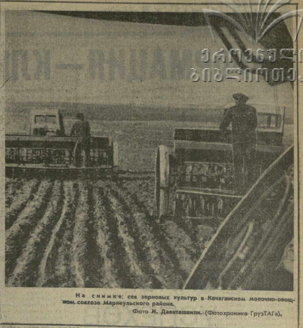
На снимке: сев зерновых культур в Качаганском молочно-овощном совхозе Марнеульского района.

Сегодня в соревнование вступают труженики Марнеульского района.