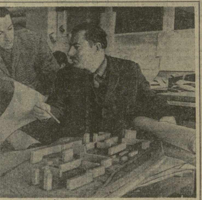
Над многими интересными проектами работает коллектив Тбилисского зонального научно-исследовательского проектного института...