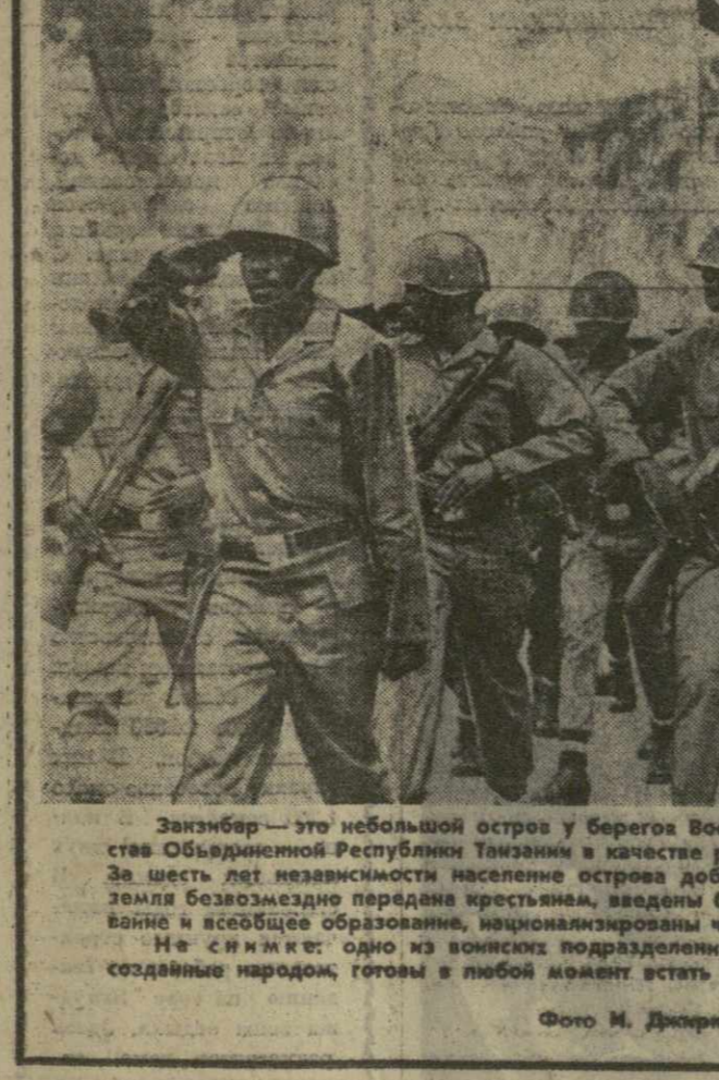
Занзибар — это небольшой остров у берегов Восточной Африки. Он входит в состав Объединенной Республики Танзании в качестве равноправного члена этого союза. За шесть лет независимости население острова добилось значительных успехов. Все земля безвозмездно передана крестьянам, введены бесплатное медицинское обслуживание и всеобщее образование, национализированы частные предприятия.