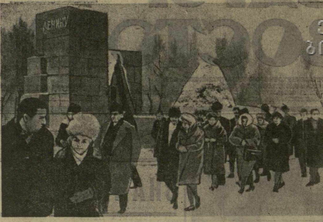
На снимке: общий вид памятника-шалаша.