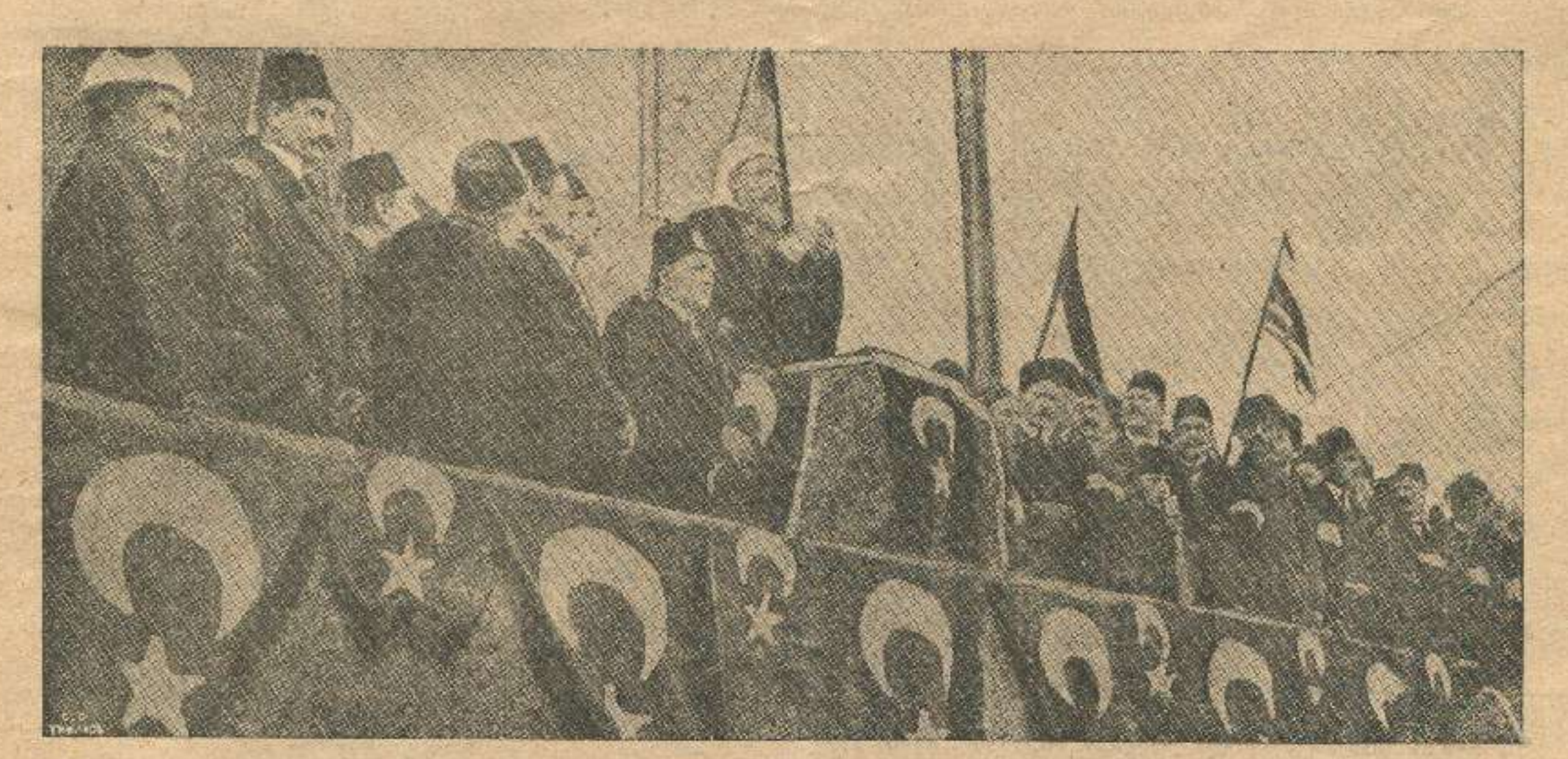
ოსმალეთის სამღვდელოების უფროსი, სტამბოლში შეჩეთის აივნიდგან კითხულობს საღმრთო ომისადში მოწოდებას.

სომხური პრესა, თქმა არ უნდა, უარს ვერ მეტყვის თავისუფალ ვალდებულობაზე, პირიქით , ზაკავკ. სლოვო "-ს სახით ხშირად ქათინაურებს შემასმენდნენ, რომ სომეხთა საკითხი გამერკვია. მათ ისე მოეჩვენათ, ვითომც კიდეც გადავჭერი სა groupe to upon one good lalanggamme. " gumpapa" ნი" ამტკიცებს, რომ მე "უვიცთა რიცხვს ვეკუთ ვნი". "არევი" უფრო თავაზიანია, მისი აზრით მე საკმაო ცნობები არ მომეპოვებოდა და არც საშუალება მქონდა სომხურ მასალებს დაეყრდნობო on object on object the both of the show of the show სცდილობს უარჰყოს ჩემი დებულებანი, არამედ და მანახვოს მე და ჩემს მკითხველებს, თუ ნამდვილად როგორია სომეხთა შეხედულობა მაი ეროვვულ კითხვების გასარკვევად. ლექველია, სწორედ ამას უნდა მიეწეროს, როდესაც მათ უმთავრეს საიერიშო ბახად გაიხადეს ჩემი წერილის შესავლის ერთი