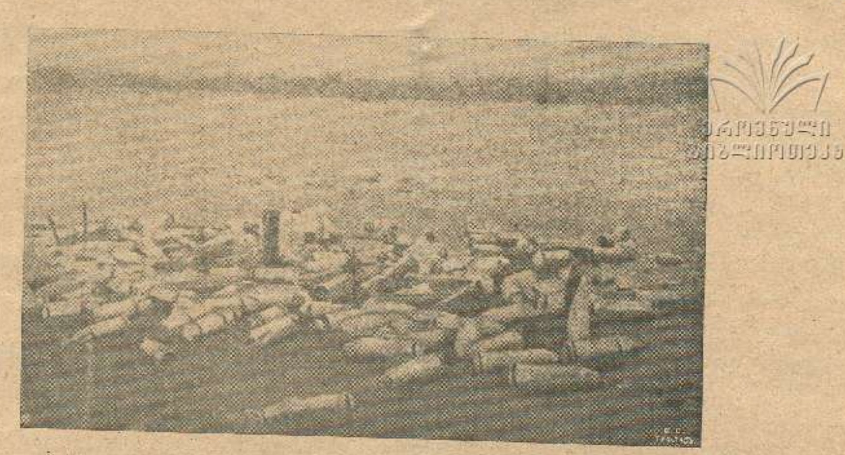
ბრძოლის ველი, გერმანიის არტილერიის ოტების შემდეგ.