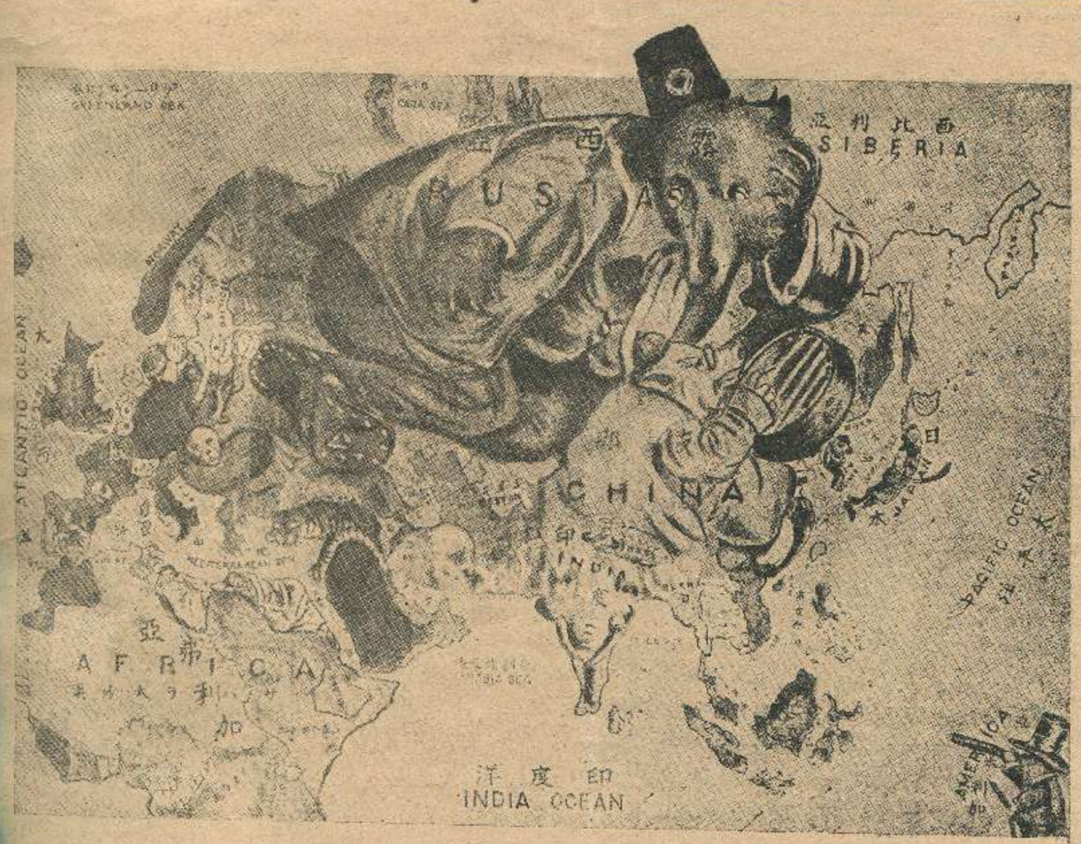
დღევანდელი სახელმწიფონი მხეცთა და ცხოველთა სახეთ,

θολικόσοι: οιδοχολι., Γαδαεβεκίй περ. № 3 რედაქცია "კლდე". დეპემისა: οιδοχολο კლდე.