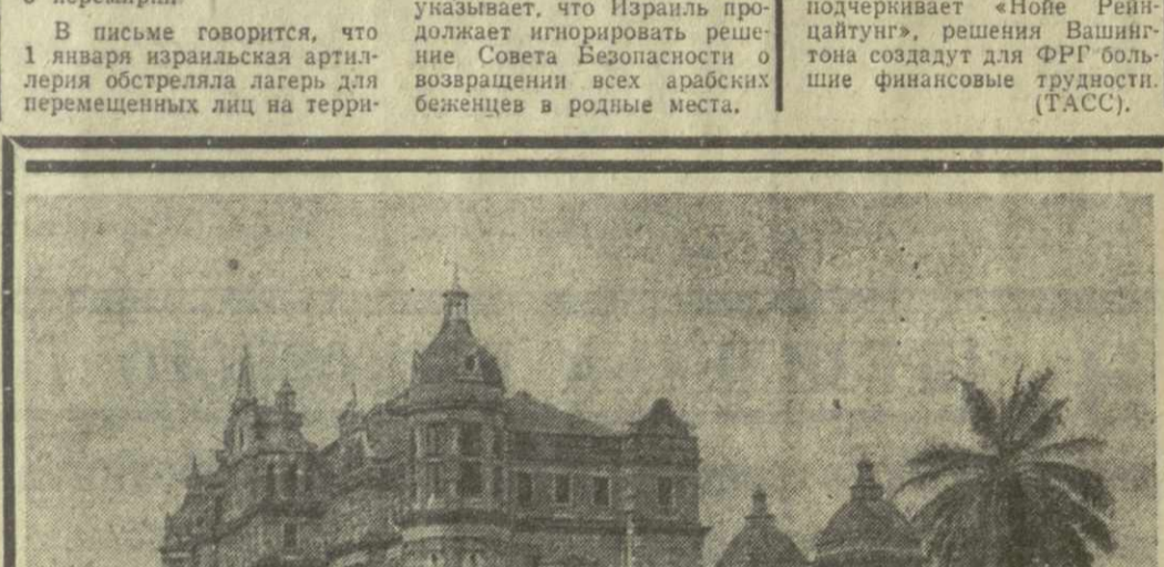
Бирма. Президентская резиденция в Рангуне.

НЬЮ-ЙОРК. 3 января. (ТАСС). Постоянный представитель Иордании при ООН направил вчера генеральному секретарю ООН У Тану письмо, в котором выражается протест против нового нарушения Израилем решений Совета Безопасности о перемещении.